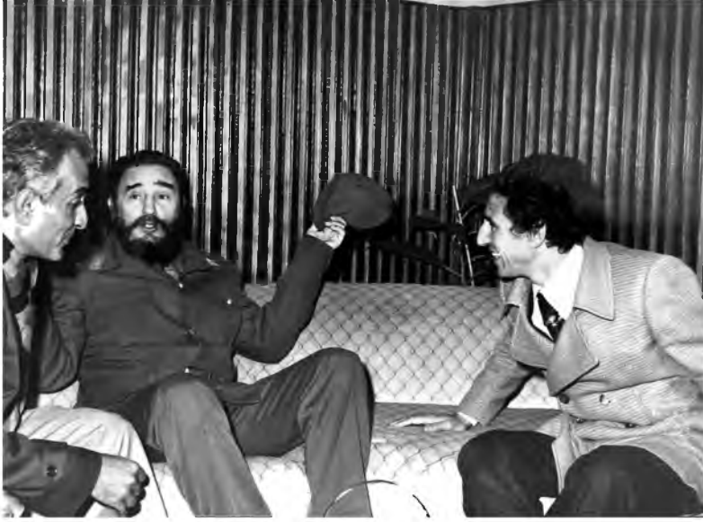
صورة تجمع بين عبد السلام جلود وفيدل كاسترو.